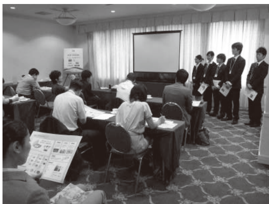
図 2 : 2012 年度国内大会の様子

学生が自分たちの活動発表をまとめていく過程を見て FA が認識したことは、「課題分析力」「活動成果の分析力 (定量・定性)」「伝える力」を高めていく必要性である。地域貢献で最も基本となるステップは、地域にどのような課題があるかについて日常の活動を通して常に考え続け、その課題に応えるための手がかりを模索することである。この基本的なステップを踏まえなければ、地域貢献は独りよがりになる危険性がある。